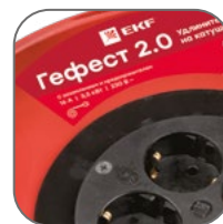
Катушка из металла толщиной 0,8–0,9 мм