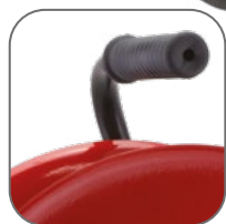
Рама из металлической трубы с резиновой рукояткой

Удлинитель на металлической катушке «Гефест 2.0» EKF PROxima могут использоваться на строительных площадках, для подключения энергоёмких потребителей в гаражах и на приусадебных участках, в том числе сварочной аппаратуры, перфораторов, электропил. Надёжный кабель КГ в резиновой изоляции выдержит как механические нагрузки, так и суммарную мощность подключенных потребителей до 3,5 кВт.