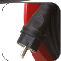
Каучуковая разборная вилка