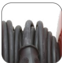
Кабель в резиновой оболочке (КГ). Длина: 30, 40, 50 м