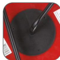
Усиленная шпуля катушки