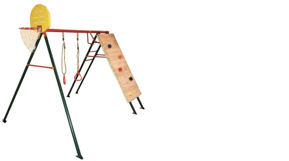
Рисунок 1 / 1-сурет

Руководство по эксплуатации ИЯУБ 40.19.00.000 РЭ игрового комплекса ИЯУБ 40.19 «Ракета» / ИЯУБ 40.19 «Ракета» ойын кешенінің ИЯУБ 40.19.00.000 РЭ пайдалану жөніндегі нұсқаулығы