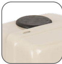
Сальник на вводе