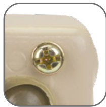
Контакт под видимое заземление