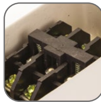
Непосредственное коммутирование нагрузок до 16 А