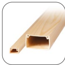
Цвет совместим с кабель-каналом EKF «дерево»