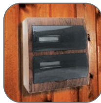
Возможность маскировки электротехнических щитов и соединений в деревянных домах