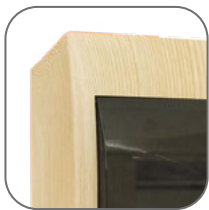
Покрытие корпуса - стойкая краска

Щиты распределительные пластиковые ЩРН-П EKF PROxima предназначены для установки модульной аппаратуры: автоматических выключателей, УЗО, таймеров, устройств управления и т.д. Используются для электромонтажа в жилых, административных, торговых помещениях. Вертикальное открывание дверцы позволяет устанавливать бокс независимо от положения соседних стен. Электрощиты изготовлены из прочного ABS-пластика.