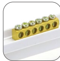
Шины N и PE в комплекте